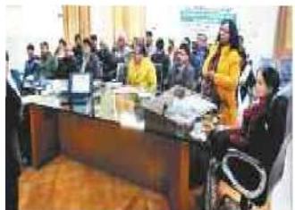
अंबाला। स्वास्थ्य विभाग के अधिकारियों को संबोधित करती डीसी।