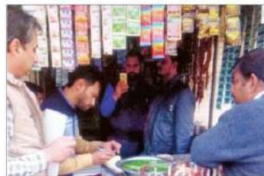
कार्रवाई करते टीम के सदस्य।